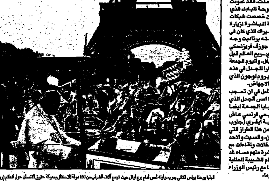
البابا يرحب بالفرنسيين في مطار باريس، حيث سيلتقي مع البابا في 22 آب